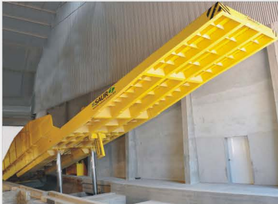
Estructura tipo embutido en el piso, con cilindros internos (bajo la plataforma). Construcción mecánica con perfil tubular.