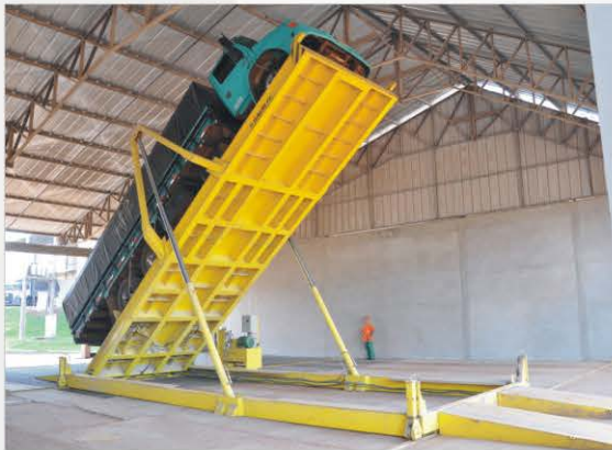
Estructura tipo superpuesta a la tolva, que también se aplica a los modelos móviles.