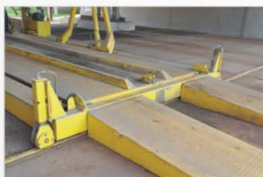
Rampa cerrada en la salida de la plataforma.