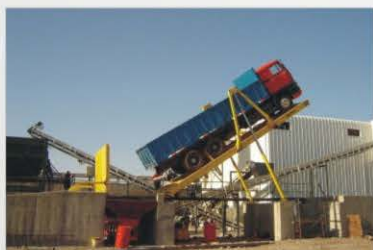
Tapa para tolva cuando se la aplica la descarga de maíz en mazorca, astillas de madera, café, mandioca, frutas, minerales, etc.