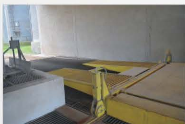
Rampa metálica enrejada: para instalarla en la entrada de la plataforma.