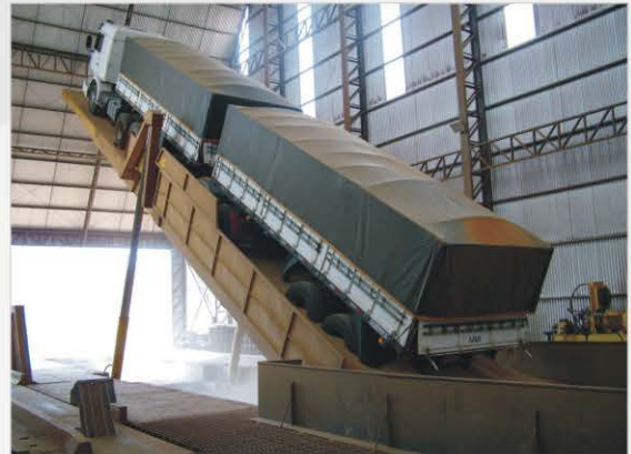
Estructura tipo pórtico, cilindros externos (en las laterales de la plataforma, adaptables donde no es posible la ejecución de hueco para cilindros).