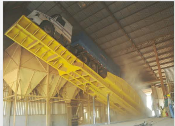
Construcción mecánica con perfil "I".